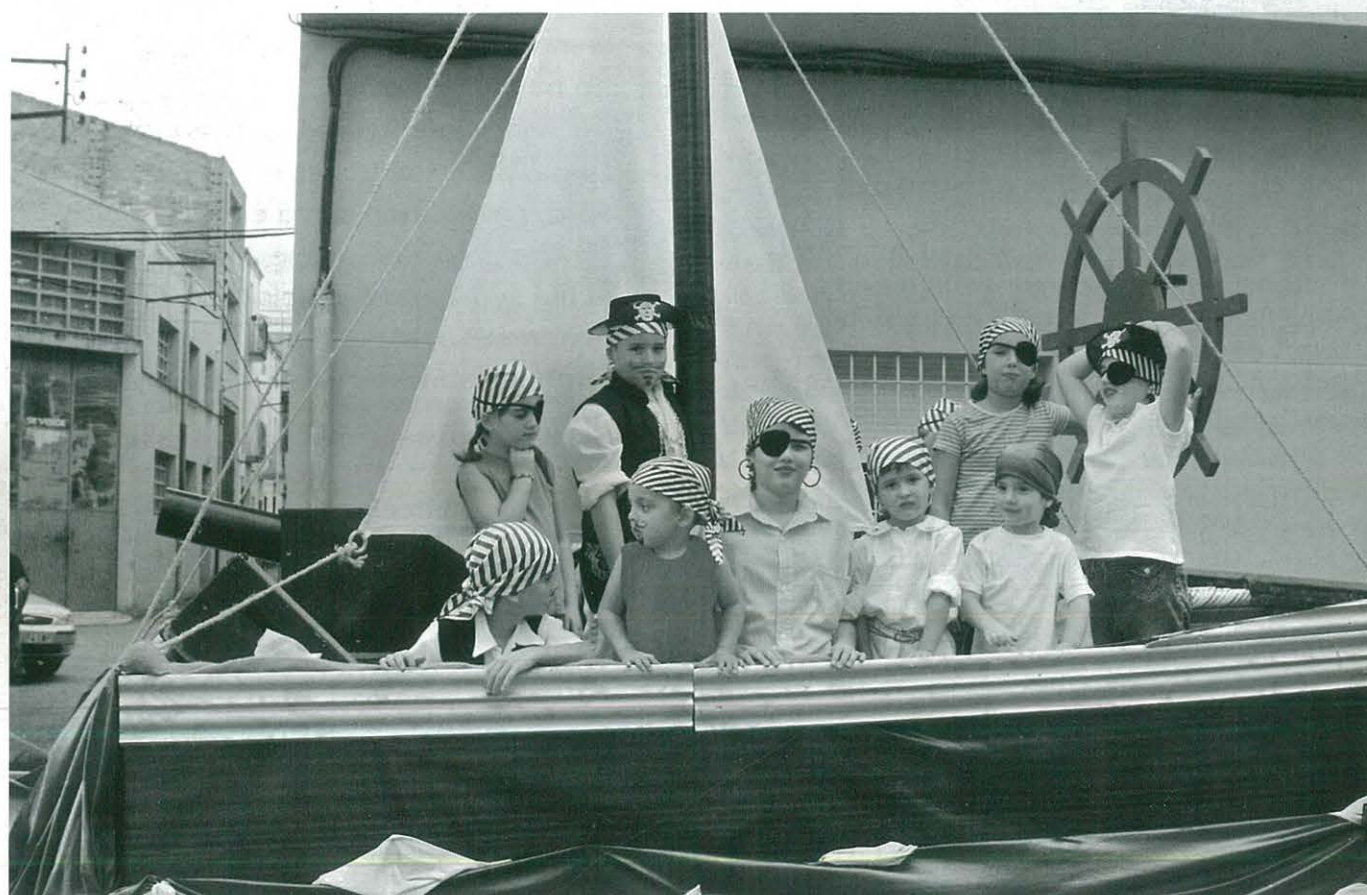
Carrossa del CCR de les Festes Majors 2005